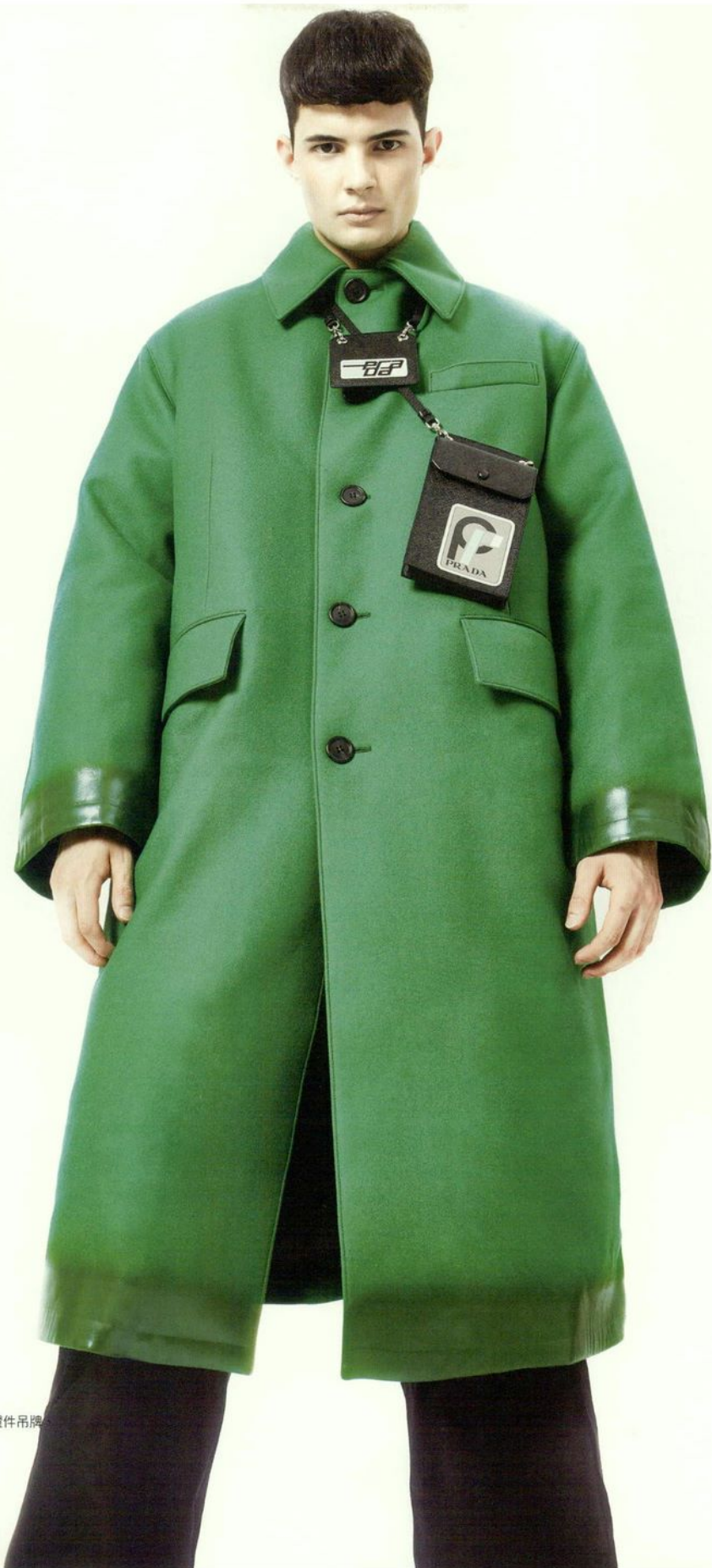
草綠色鋪棉大衣、黑色長褲、證件吊牌 工作證吊牌 by Prada®

化妝 / Ponce Chen 髮型 / Ken Chou 模特兒 / Paulo (星訊)